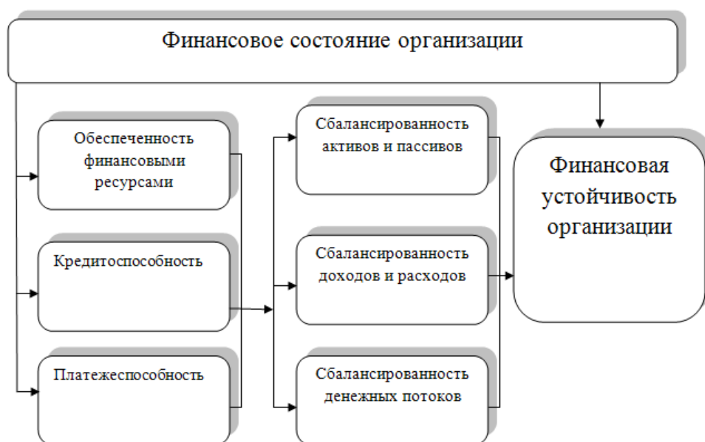
Рисунок 3.3 - Финансовое состояние организации 2

Если рисунок является авторской разработкой, необходимо после заголовка рисунка поставить знак сноски и указать в форме подстрочной сноски внизу страницы, на основании каких источников он составлен, например: