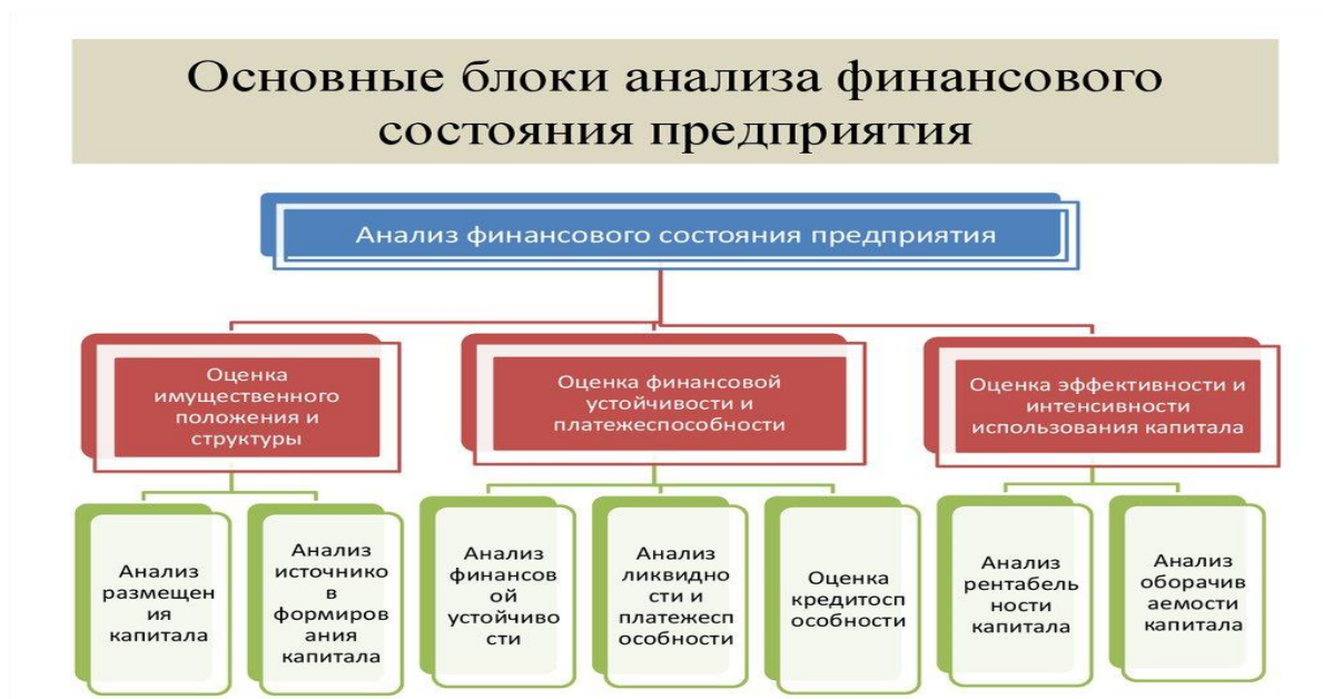
Рисунок 6 – Традиционная схема анализа финансового состояния организации [7, с. 45]

Если рисунок является авторской разработкой, необходимо после заголовка рисунка поставить знак сноски и указать в форме подстрочной сноски внизу страницы, на основании каких источников он составлен, например: